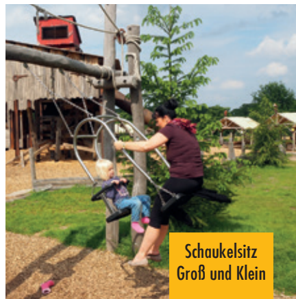
Schaukelsitz Groß und Klein

Hoch hinaus, den ganzen Körper losgelöst von der Schwerkraft fühlen, den Wind im Gesicht spüren: Schaukeln. Ein Klassiker auf jedem Spielplatz. Wir bieten, neben den altbewährten Schaukeln, eine Vielzahl unterschiedlicher Schaukeln an, die dem Grundgefühl des Schaukelns noch etwas hinzugeben – zu zweit, zu dritt oder gar zu viert schaukeln, mit Mama im Blick gemeinsam schaukeln, Rücken an Rücken oder mit Lehne, so dass Menschen mit Einschränkung selbstverständlich mitschaukeln können.