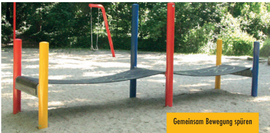
Gemeinsam Bewegung spüren