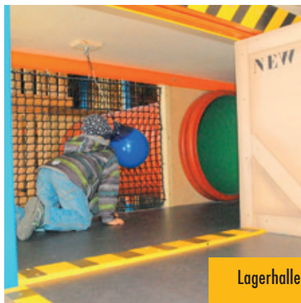
Lagerhalle zum Bespielen