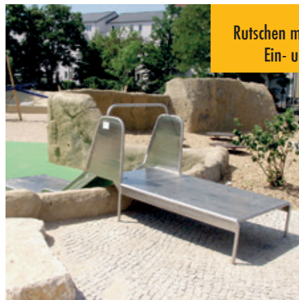
Rutschen mit barrierefreiem Ein- und Ausstieg