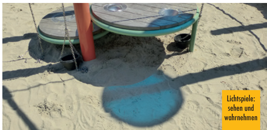
Lichtspiele: sehen und wahrnehmen