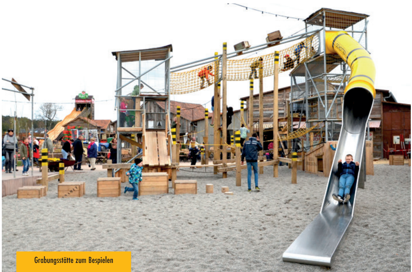
Grabungsstätte zum Bespielen