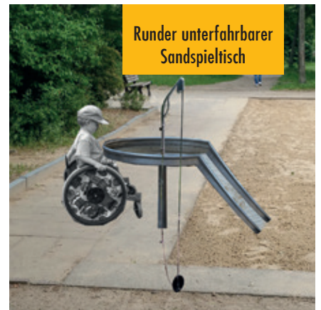
Runder unterfahrbarer Sandspieltisch