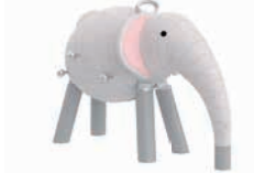
ELLI DER ELEFANT