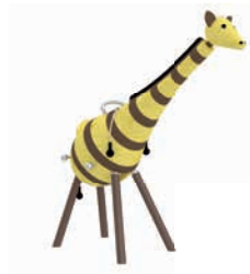
GUNDULA DIE GIRAFFE

AG: 3 – 99 FH: 1,45 m SB: 3,90 x 4,60 m PB: 3,90 x 4,60 m