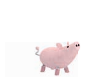
FRANZI DAS SCHWEIN

AG: 3 – 99 FH: 1,00 m SB: 3,60 x 4,20 m PB: 3,60 x 4,20 m