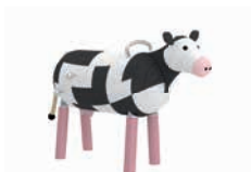
ERNA DIE KUH