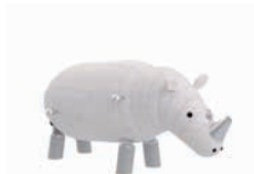
NILS DAS NASHORN

AG: 3 – 99 FH: 1,05 m SB: 3,70 x 4,70 m PB: 3,70 x 4,70 m