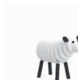
WILLI DAS SCHAF

AG: 3 – 99 FH: 1,90 m SB: 4,50 x 5,20 m PB: 4,50 x 5,20 m