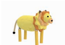
LUDWIG DER LÖWE

AG: 3 – 99 FH: 0,75 m SB: 3,90 x 5,80 m PB: 3,90 x 5,80 m