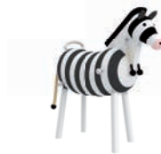
ZOE DAS ZEBRA

AG: 3 – 99 FH: 1,00 m SB: 3,90 x 5,20 m PB: 3,90 x 5,20 m