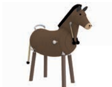
HOTTI DAS PFERD

AG: 3 – 99 FH: 1,45 m SB: 3,80 x 5,20 m PB: 3,80 x 5,20 m