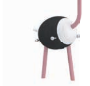
SVEN DER STRAUSS

AG: 3 – 99 FH: 1,45 m SB: 4,20 x 5,00 m PB: 4,20 x 5,00 m