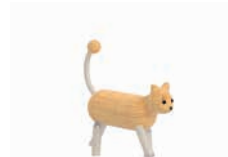
LULU DIE KATZE

AG: 3 – 99 FH: 0,75 m SB: 3,40 x 3,95 m PB: 3,40 x 3,95 m