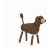
POLLY DER HUND