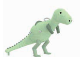
RICHARD DER T-REX

AG: 3 – 99 FH: 1,90 m SB: 4,50 x 5,20 m PB: 4,50 x 5,20 m