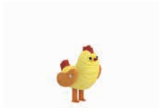
HENRIETTE DAS HUHN